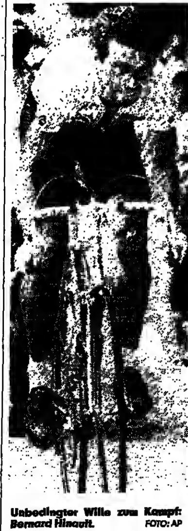
Unbedingter Wille zum Kampf: Bernard Hinault.